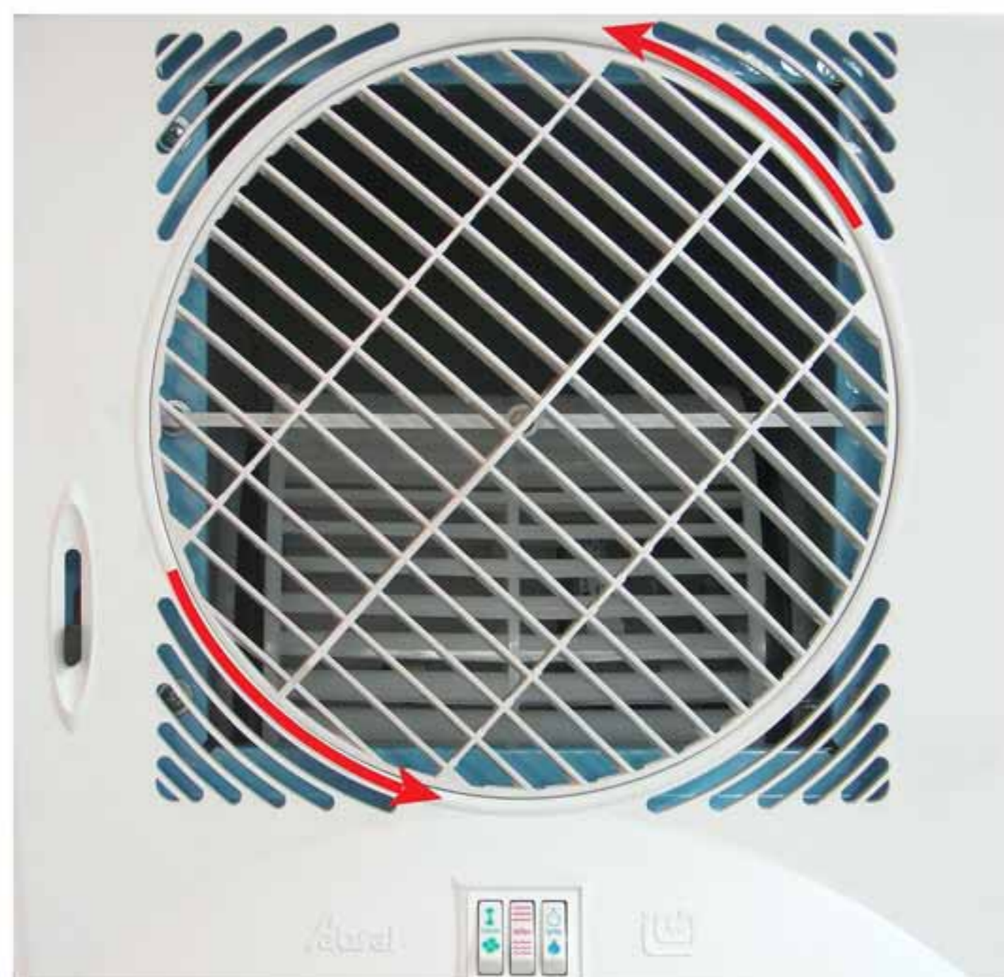
• قاب دوار